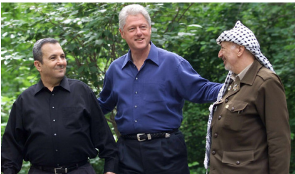
[Da sinistra: Ehud Barak, Bill Clinton, Yasser Arafat a Camp David.]

Credo sia abbastanza chiaro quello che deve succedere. In primo luogo, Stati Uniti ed Israele devono unirsi al resto della Comunità Internazionale, devono rispettare il Diritto Internazionale. Non credo si debba sottovalutare quest'ultimo punto, è una questione molto importante. Se Israele non rispetta il Diritto Internazionale, la si deve rendere responsabile delle sue azioni, esattamente come qualsiasi altro stato del mondo.